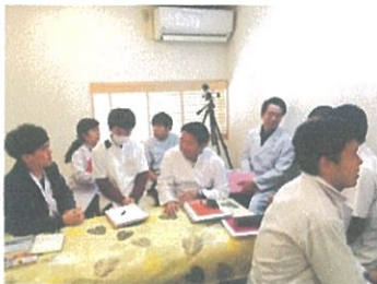
【東洋医学嫌いでも安心！】

のべ 16892人 を導いた治療院コンサルタントが実践する 治療技術の 具体的活用法 まで！ 技術と経営力 の両輪を実現！