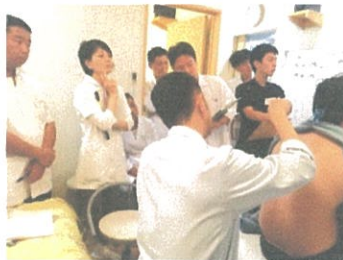
【誰でも実践可能な簡単施術】