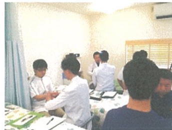
【内科疾患等にも自信が持てる】