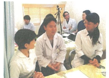
【鍼灸師として食べていく方法】